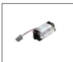
NiMH 4,8V 600mAh: 73 483 90