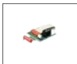
Potentialfri kontakt: 73 483 89