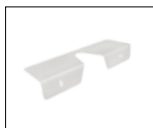
Väggkonsol: 73 408 19