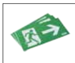
Piktogramset anvisning: 73 416 42