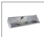
Skyddskapsling: 73 419 77